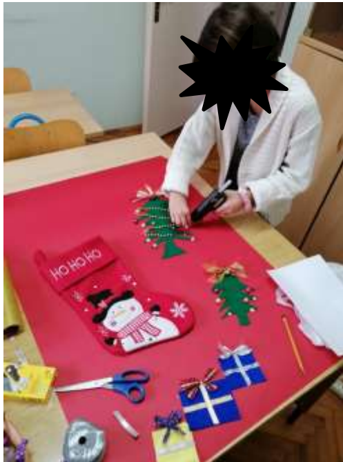
Slika 2. Izrada plakata za „Božić i Nova godina“

Sportska sekcija – zbog epidemioloških razloga nije bilo uobičajenog ekipnog ili grupnog sportskog druženja. Djeca su nakon obavljenih školskih obveza pojedinačno ili najviše u dvoje ukoliko su iz istog razreda uz pratnju odgojitelja provodila vrijeme na školskom dvorištu igrajući badminton, preskakanje užeta, vijače, pucanje na gol i košarku.