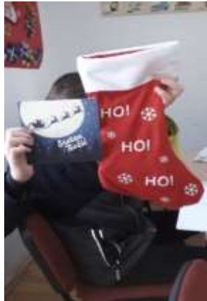
Slika 7. Podjela poklona za Božić