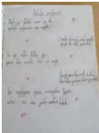
Slika 6. Pisanje pjesmica

Samostalne aktivnosti - rješavanje matematičkih zadataka, izrada vlastite mentalne mape, pisanje i osmišljavanje zagonetki i pjesmica.