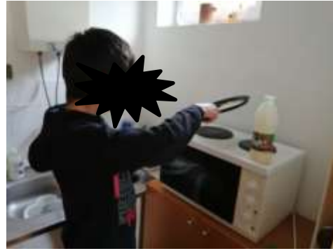
Slika 3. i 4. Pečenje muffina i palačinki

Društvene igre – djeca su rado nakon učenja igrala različite društvene igre u paru ili s odgojiteljima (Uno, Lotti Karotti, Alias, Crni Petar, ploča za crtanje s magnetom, Mikado, Pogodi tko sam i slično).