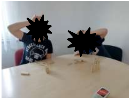
Slika 5. Igranje društvenih igra

Društvene igre – djeca su rado nakon učenja igrala različite društvene igre u paru ili s odgojiteljima (Uno, Lotti Karotti, Alias, Crni Petar, ploča za crtanje s magnetom, Mikado, Pogodi tko sam i slično).