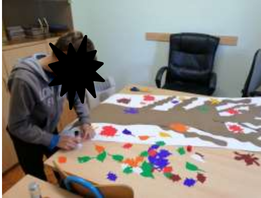
Slika 1. Izrada plakata na temu „Jesen“